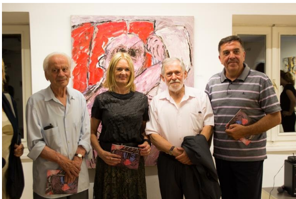
Samostalna izložba „Nježna destrukcija“, autor: Robert Fišer